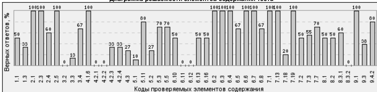
Диаграмма решаемости элементов содержания теста

Примечание: Расшифровка используемых в отчете кодов размещена на Интернет–портале «Инновации в образовании» по адресу http://sinncom.ru/content/avmk/index1.htm в разделе «МЕТОДИСТУ» (классификатор заданий.)